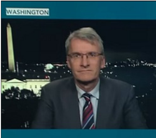
Elmar Theveßen (Bildschirmfoto)

Und, zack, hatte mich Hayali blockiert. Diese Frau erhöht sich selbst. Wie so viele ihrer selbstgerechten Kolleginnen und Kollegen nutzt sie ihre Macht und teilt gerne aus gegen andere, deren Meinungen nicht genehm sind. Kritik an der eigenen Person wird mit einem Angriff gegen den Staat oder gegen "unsere" Demokratie gleichgesetzt.